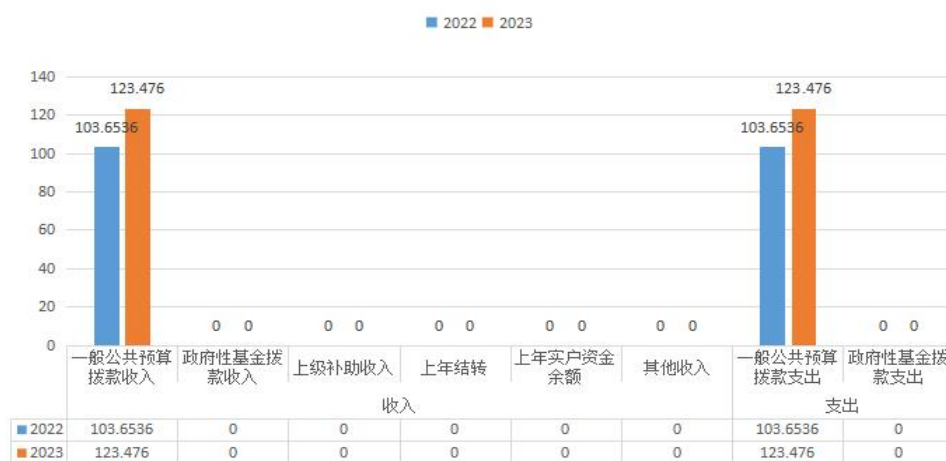
收支预算总体情况

按照综合预算的原则，本部门所有收入和支出均纳入部门预算管理。2023年本部门预算收入123.476万元，其中一般公共预算拨款收入123.476万元、政府性基金拨款收入0.00万元、上级补助收入0.00万元、事业收入0.00万元、事业单位经营收入0.00万元、对附属单位上缴收入0.00万元、用事业基金弥补收支差额0.00万元、上年结转0.00万元、上年实户资金余额0.00万元、其他收入0.00万元，2023年本部门预算收入较上年增加19.8224万元，主要原因是人员调资；2023年本部门预算支出123.476万元，其中一般公共预算拨款支出123.476万元、政府性基金拨款支出0.00万元，2023年本部门预算支出较上年增加19.8224万元，主要原因是人员调资。